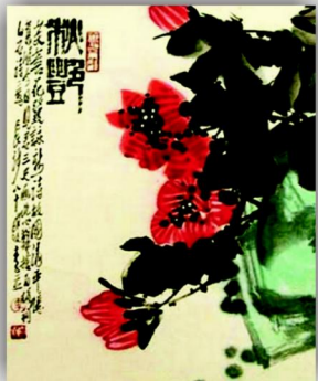
CHU FENG YIN CAO